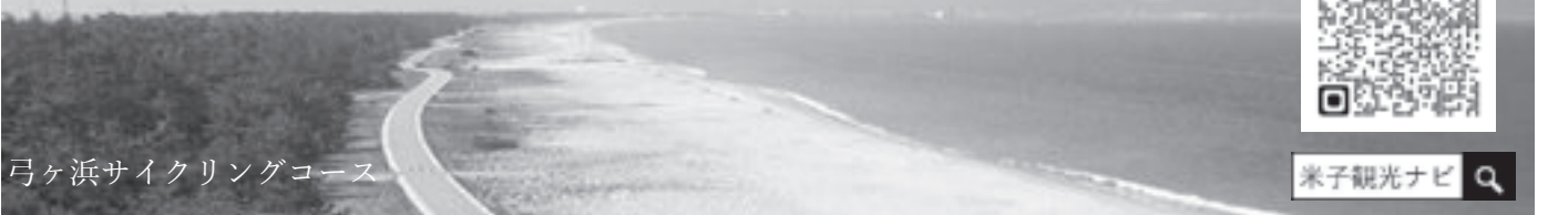
弓ヶ浜サイクリングコース